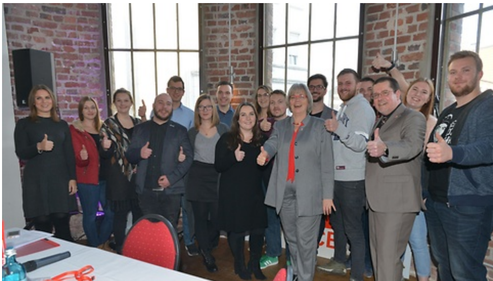
Bezirksjugendausschuss Bezirk Moers

Ohne starke Gewerkschaften mit starken Mitgliedern wären diese Aufgabenfülle nicht zu schaffen. Wir alle sind das Gesicht der IG BCE. Darauf kann Mann und Frau stolz sein! Wir wachsen weiter in den Betrieben, diese Stärke muss beibehalten werden, das machen wir seit 128 Jahren gut- alle