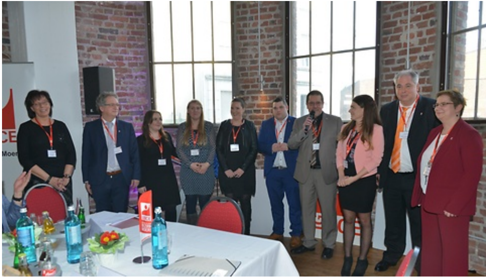
Team Bezirk Moers